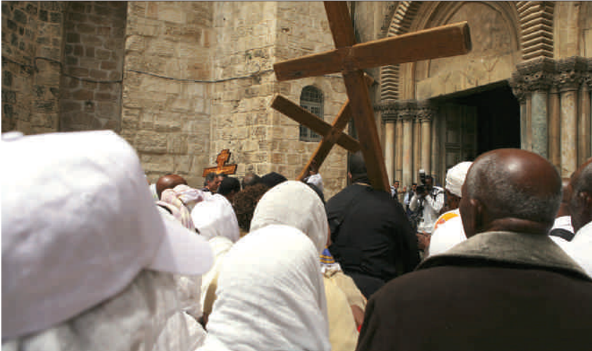
Karfreitag: Pilger in der Kreuzprozession vor der Grabkirche in Jerusalem

Die erste Folge dieses Anschlages war, dass sich kein Mann beim Pfarrer erbot, das Kreuz zu tragen. Der Pfarrer schüttelte den Kopf. So schnell ließen sich die Leute also einschüchtern? Er war noch erstaunter, als einer nach dem andern bei ihm vorsprach, um ihn zu bitten, sich nach der Verfügung zu richten und in diesem Jahr doch die Prozession in der Kirche abzuhalten. Dort könne man auch andächtiger beten als auf der Straße.