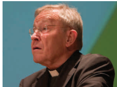
Walter Kardinal Kasper

Beunruhigend aber ist, dass Papst Franziskus selbst die Rede Kaspers lobte. Er habe diese noch einmal „vor dem Einschlafen, aber nicht zum Einschlafen“ gelesen und darin „profunde Theologie“ und „klares Denken“ gefunden. Kaspers Vortrag sei ein Beispiel für eine „kniende Theologie“.