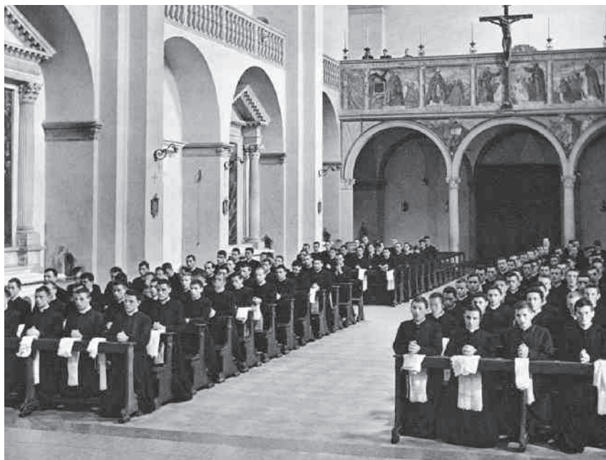
Seminar von Padua zu Zeiten Guiseppe Sartos

schlechthin vorbildlich, tatkräftig und regsam ist, und schließlich restlos bereit, für Christus Heldenhaftes zu leisten und zu erdulden. (...) Ist einmal die Erneuerung und das Wachstum der priesterlichen