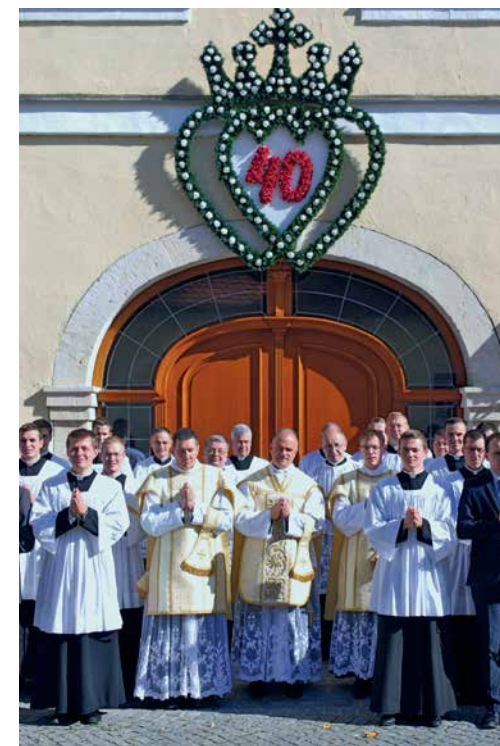
Besuch des Generaloberen 13./14 Oktober 2018

Nichtsdestoweniger bin ich mit Ihnen und dem Seminar im Gebet und Dank an den dreifaltigen Gott verbunden für dieses großartige Werk der Kirche. Wohl kein anderes Haus innerhalb der deutschen Diözesen und darüber hinaus hat in den vergangenen 40 Jahren so viel Segen über die Kirche gebracht, ver-