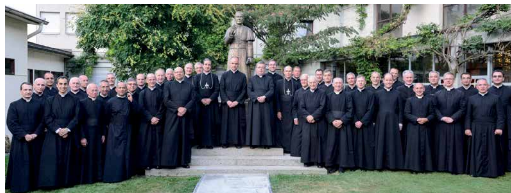
Kapitulare des Generalkapitels 2018

Wir selbst müssen immer unseren Blick auf die Tradition erneuern, und zwar nicht nur in einer ganz theoretischen Form, sondern wahrhaft übernatürlich, im Licht des Opfers unseres Herrn Jesus Chris-