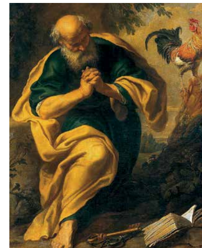
Die Reue des hl. Petrus

Die unvollkommene Reue hat als Motiv die Furcht vor der gerechten Strafe, die man für seine Sünden verdient hat. Diese Reue hat, wer