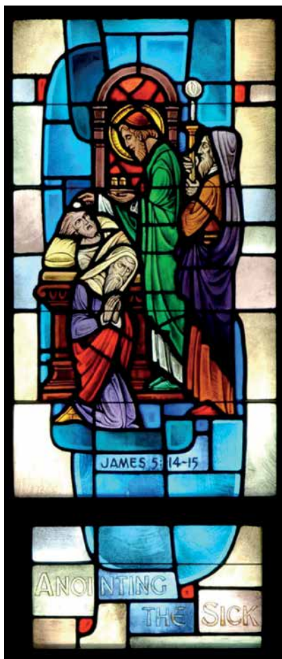
Letzte Ölung; Kirche der hl. Kolumba in Oxon Hill, Maryland

riens in diesem entscheidenden Augenblick. Sie kann uns diese Gnade erwirken, im Sterben einen Priester an unserer Seite zu haben, der uns die letzten Tröstungen der Kirche schenkt – für ein seliges Sterben.