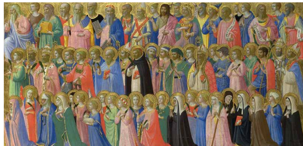
Gemeinschaft der Heiligen

So strömt die Gnade von Christus als dem Haupt auf seine Glieder über. Aber auch die Güter eines Gliedes kommen allen zugute. So schreibt der Römische Katechismus: