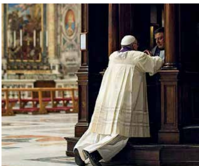
Der Papst beichtet

Den ersten Nachlass der Sünden gewährt das Sakrament der Taufe, durch das nicht nur die Erbsünde vergeben wird, sondern auch alle persönlichen Sünden sowie alle Sündenstrafen. Die Taufe ist also wahrhaft „das Bad der Wiedergeburt und der Erneuerung im Heiligen Geist“ (Tit 3,5); durch sie stirbt der alte Mensch und steht zu einem neuen Leben auf (vgl. Röm 6,4).